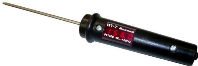
Рисунок 1 – Внешний вид термометра–щупа цифрового ИТ–7

2.14 Масса термометра – не более 0,18 кг.